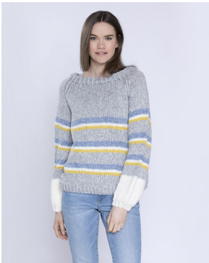
Se også Mabel Stripegenser | LG19-16

Tips! Prøv Lun Ull i samstrikk med de andre garntypene fra Linde Garn.